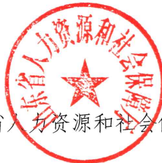
山东省人力资源和社会保障厅