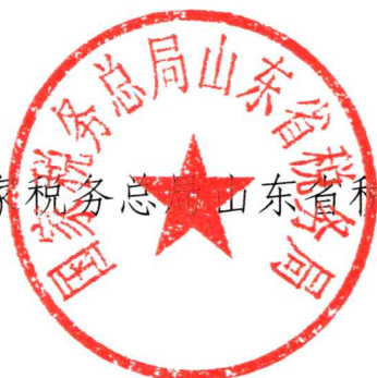
国家税务总局山东省税务局