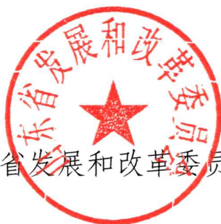
山东省发展和改革委员会

本实施意见有关残疾人就业、培训、保障金使用等未尽事宜,按照《山东省残疾人就业办法》(省政府第311号令)、《关于印发山东省残疾人就业保障金征收使用管理办法的通知》(鲁财综〔2018〕31号)、《关于促进残疾人按比例就业的实施意见》(鲁残联发〔2015〕21号)有关规定执行。