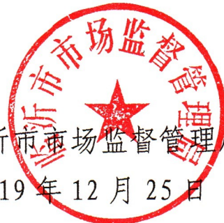
临沂市市场监督管理局