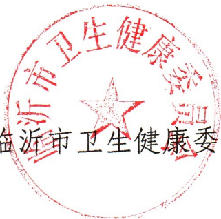
临沂市卫生健康委员会