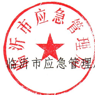
临沂市应急管理局